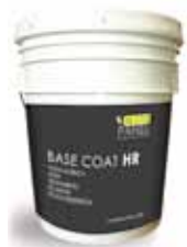
Cubeta de 8 litros 10 kg