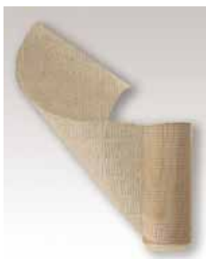
Cinta de fibra de vidrio rollo de 0.15 x 23 m