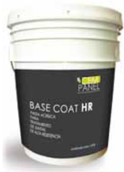
Cubeta de 19 litros 25 kg