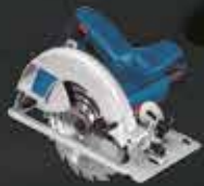
Sierra circular (cortes a baja velocidad)

El corte del Cempanel® debe ser por maquinaria como es caladora, o sierra circular con control de baja velocidad el disco debe ser de punta de diamante o carburo de tungsteno.