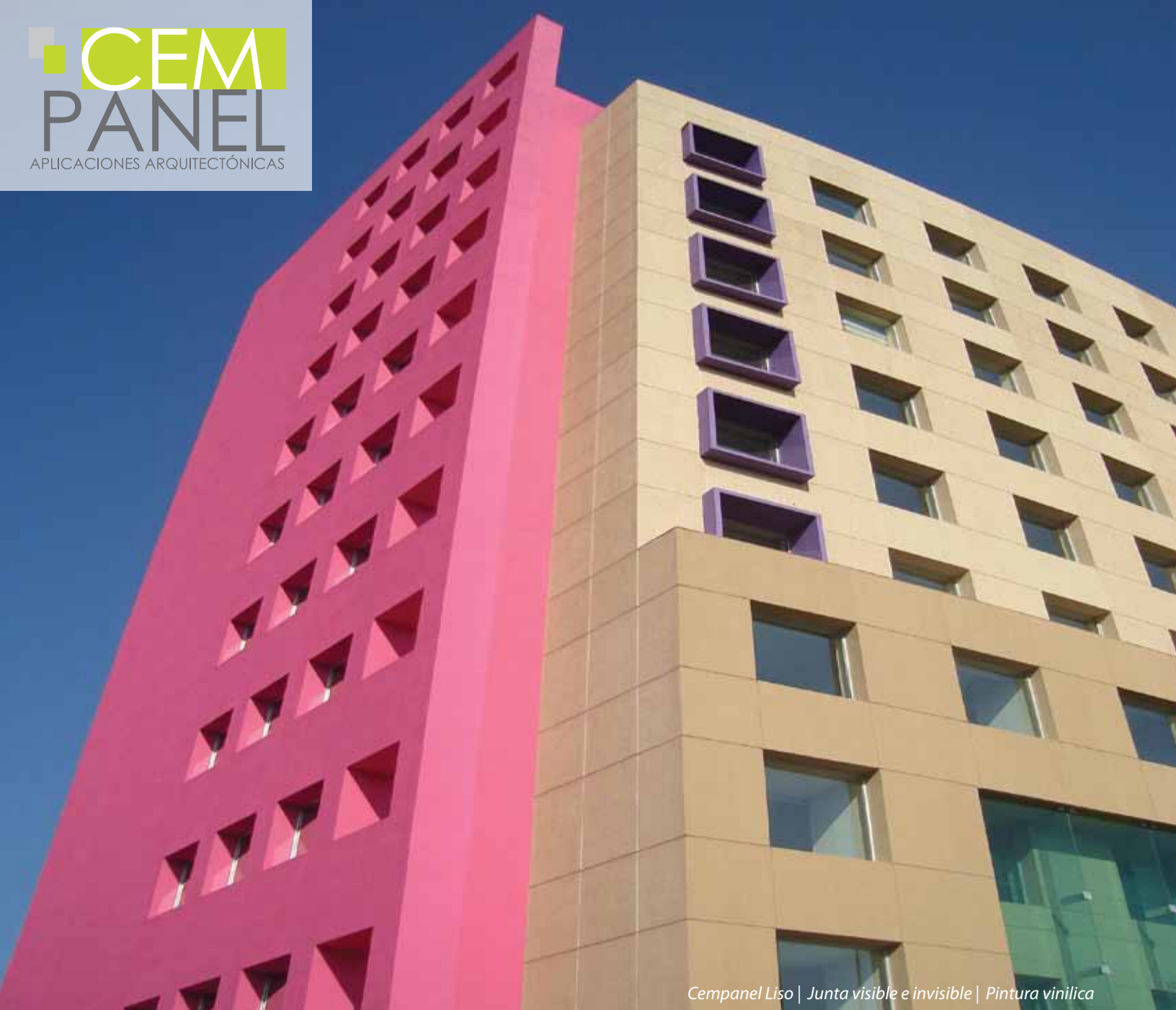
Cempanel Liso | Junta visible e invisible | Pintura vinilica