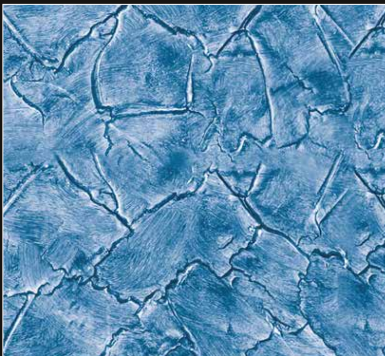
CRAKELATTO + CT 21