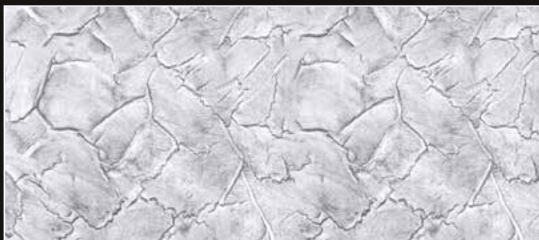
CRAKELATTO + CT 25