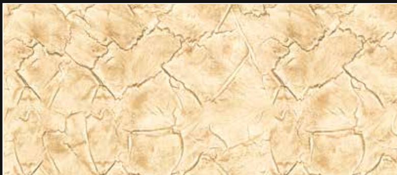
CRAKELATTO + CT 15