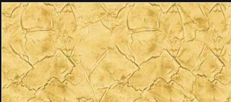
CRAKELATTO + CT 09