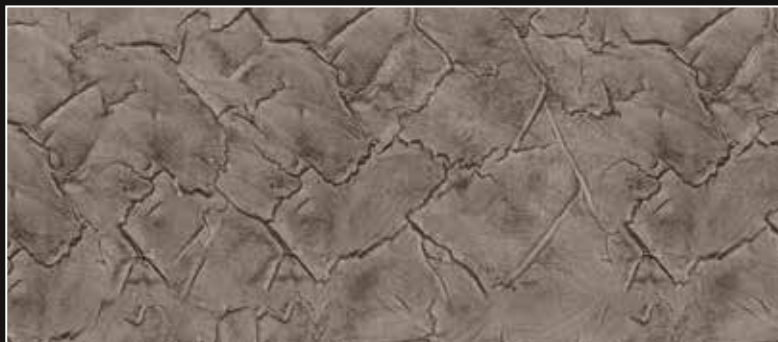
CRAKELATTO + CT 17