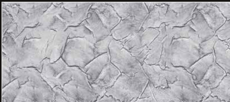
CRAKELATTO + CT 18