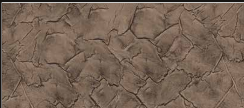
CRAKELATTO + CT 16