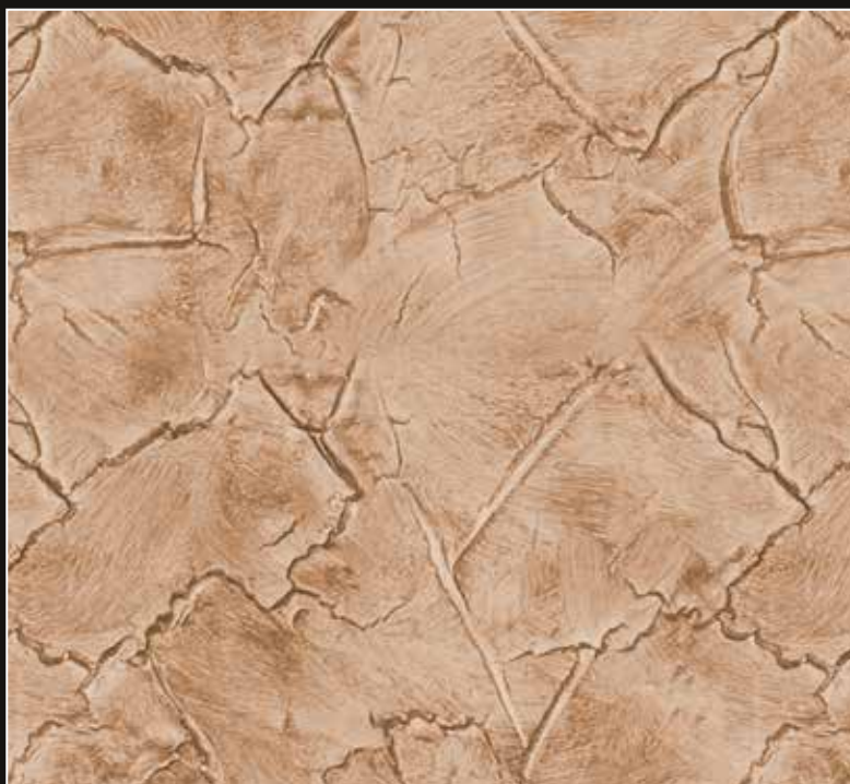
CRAKELATTO + CT 20