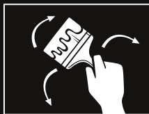
Aplicar FERRÁ con brocha a una o dos manos en el sentido de la textura.