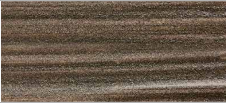
*FR 01 + CASCARA N. 100