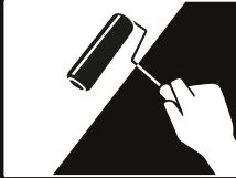
Limpiar la superficie y sellar con SOTTOFONDO 1000, 3xl ó 5xl.