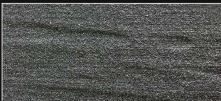
**FR 04 + CÁSCARA N. 100