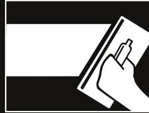
Alisar con COVERPLAST o COVERMIX