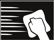
Colocar CÁSCARA DE NARANJA con llana de acero inoxidable, realizar con brocha el acabado de izquierda a derecha, posteriormente pasar el tampon en la misma dirección, formando líneas irregulares. Dejar orear y planchar con espátula.