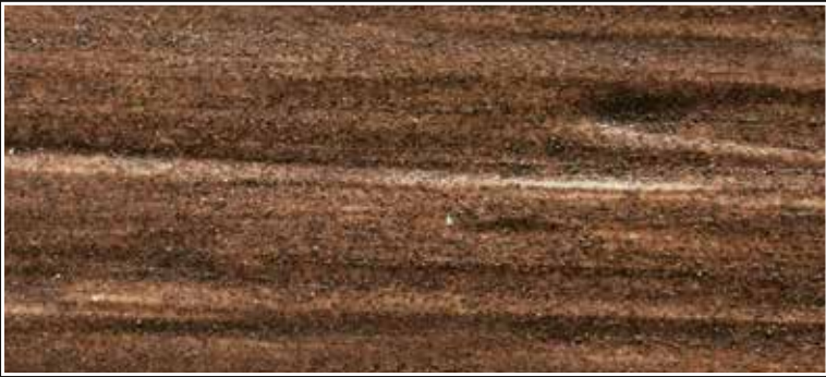
*FR 02 + CASCARA N. 100