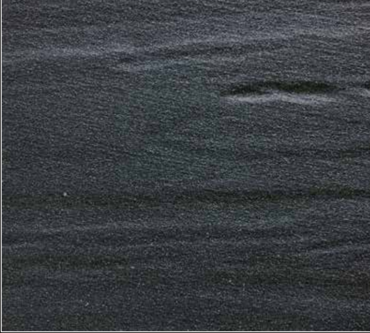
**FR 07 + CÁSCARA N. 100