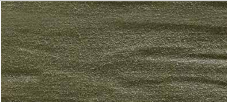
**FR 03 + CASCARA N. 100