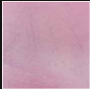
PE 27 + COLORMIX 25