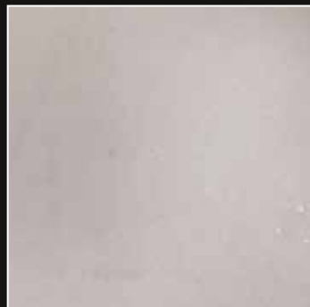
PE 10 + COLORMIX 10