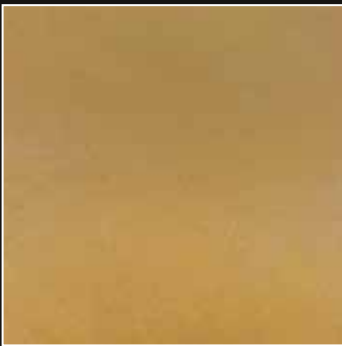
PE 13 + COLORMIX 13