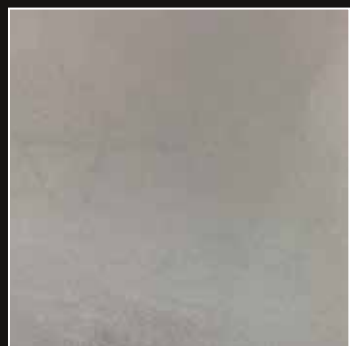
PE 09 + COLORMIX 09