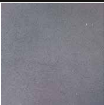
PE 08 + COLORMIX 08