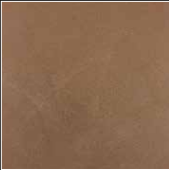
PE 17 + COLORMIX 16