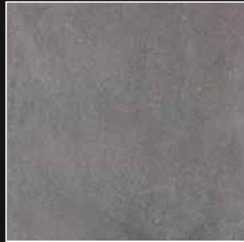
PE 06 + COLORMIX 06