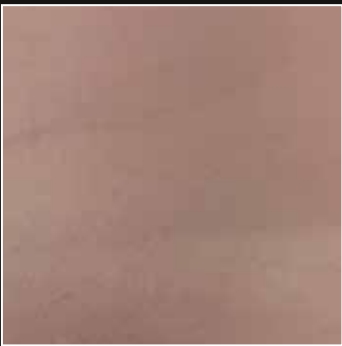
PE 28 + COLORMIX 26