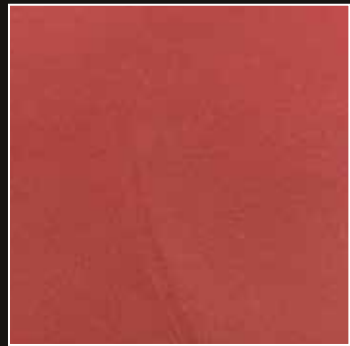
PE 29 + COLORMIX 27