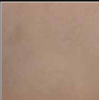
PE 12 + COLORMIX 12