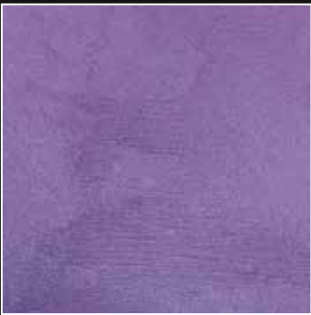
PE 26 + COLORMIX 24