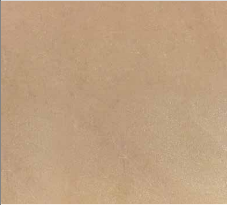
PE 03 + COLORMIX 03