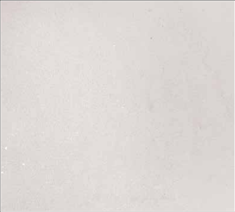
PE 01 + COLORMIX 01