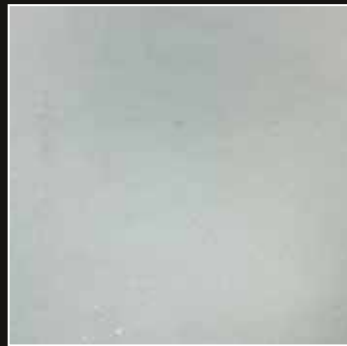
PE 25 + COLORMIX 23